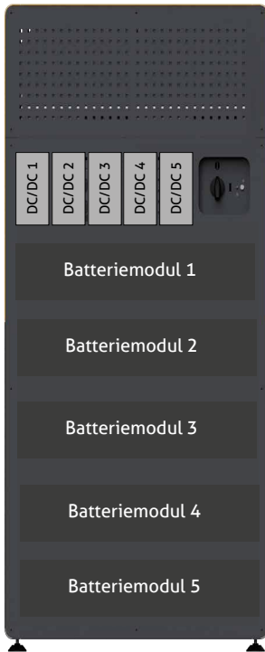
Abb. 18: Nummerierung der Steckplätze für Moduleinschübe